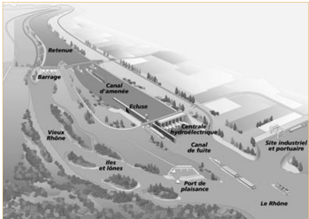
► Figure 2 – L'aménagement type.

La valeur des débits réservés a évolué avec le temps. À l'exception de la chute de Donzère-Mondragon, la première chute avec dérivation, les débits réservés, pour les chutes du bas Rhône mises en service avant 1980, sont en hiver compris entre 1/100 et 1/300 du module, et en été