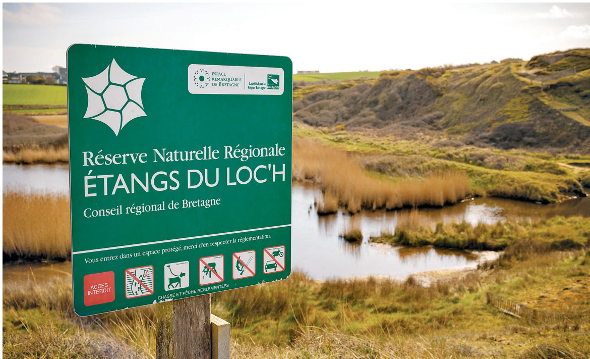
Photo 2 – Réserve naturelle régionale du Loch.

L'analyse de la nature de l'ouvrage et de la situation juridique des acteurs a démontré l'absence de responsabilité juridique des parties prenantes sur l'ouvrage. Par défaut, l'État reste responsable de l'ouvrage et doit en assumer l'entretien.