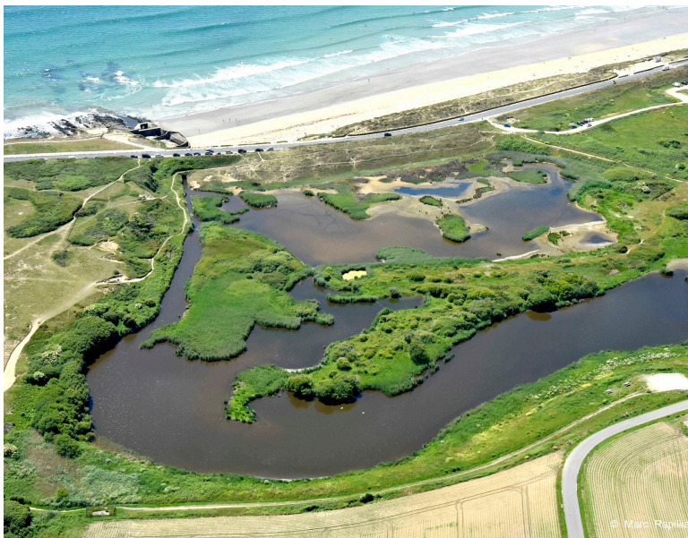
Photo 1 – Étang du petit Loch et ouvrage de sortie en mer.