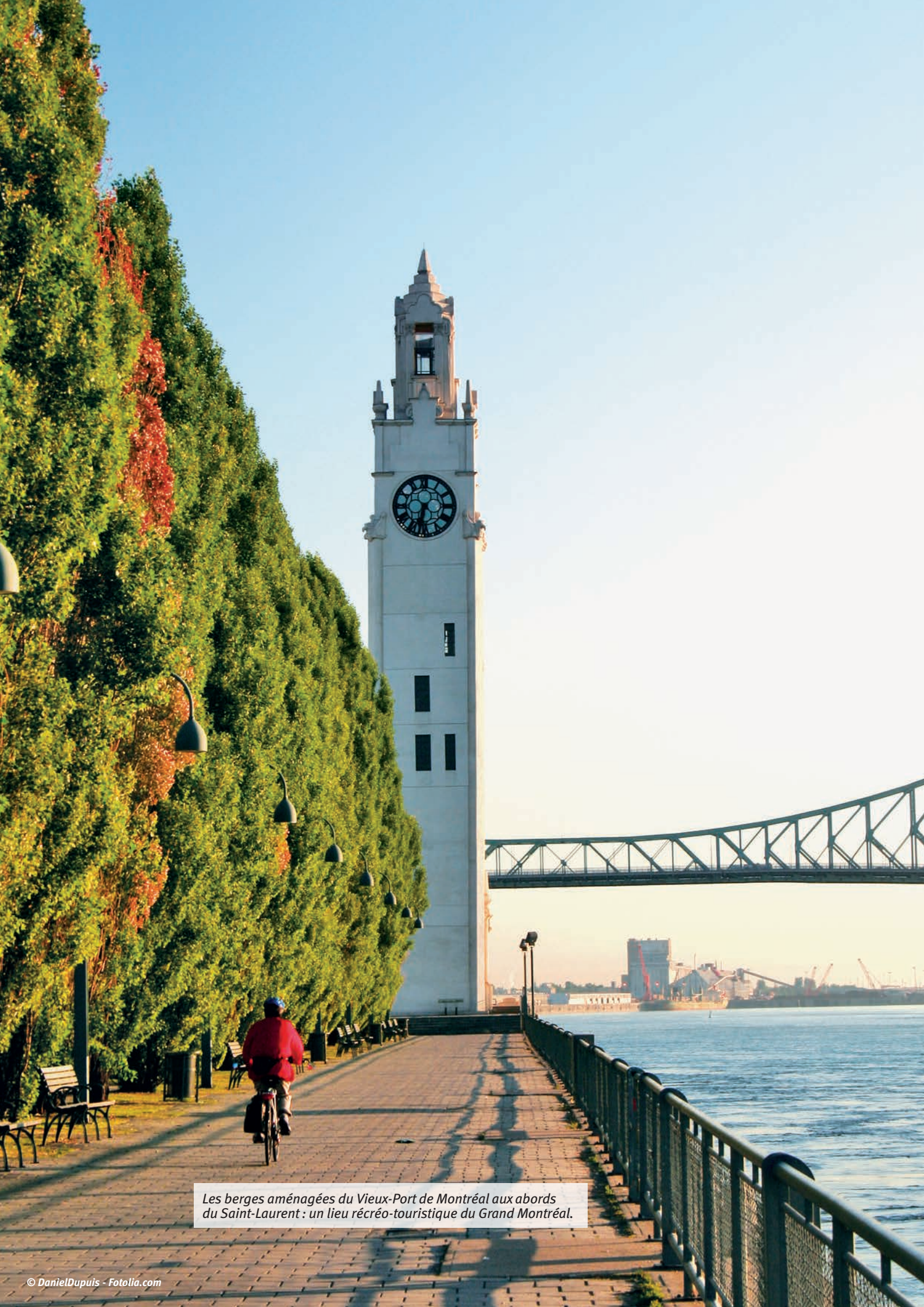
Les berges aménagées du Vieux-Port de Montréal aux abords du Saint-Laurent : un lieu récréo-touristique du Grand Montréal.