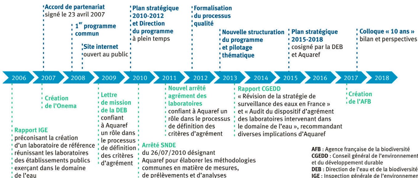
1 Les étapes-clés du programme Aquaref (texte en bleu) et de la mise en œuvre du schéma national des données sur l'eau (texte en vert).