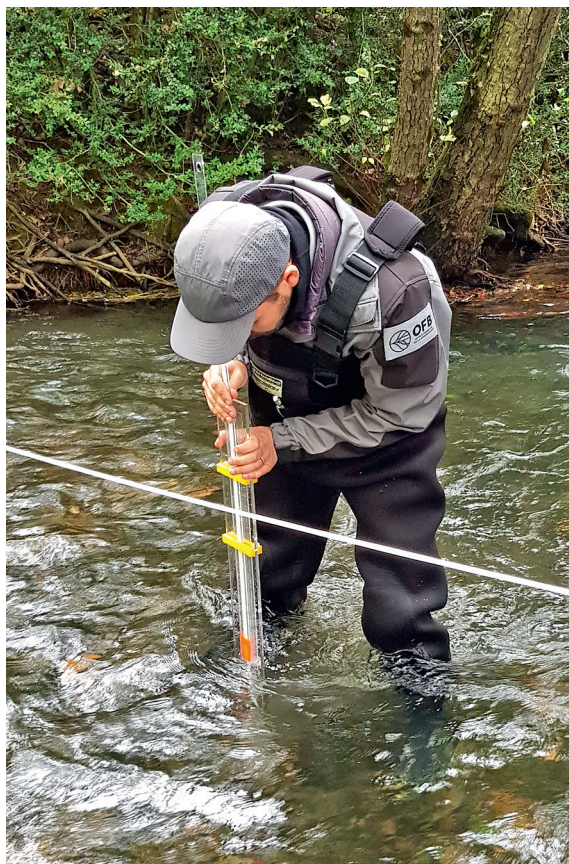
Photo 1 – Déploiement d'une perche à charge dynamique sur le Durzon à Nant (Aveyron) lors d'une formation à la mesure du débit minimum biologique.

sur la verticale, V (en m/s). On calcule ensuite la vitesse moyenne sur la verticale à partir de \Delta h à l'aide d'une formule semi-empirique établie par Pike et al. (2016).