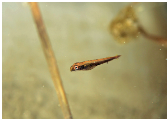
Photo 2 – Alevin de brochet d'environ 15 mm dont le sac vitellin n'est pas totalement résorbé. Photographie prise dans un îlot flottant en mai 2020.

ments de ce projet, de nouveaux prototypes plus grands, plus fonctionnels, plus esthétiques et bannissant l'utilisation de plastique pour les flotteurs, ont été imaginés et pourraient être testés prochainement. Enfin, dans la continuité du projet UROS, le Pôle R&D ECLA (Pôle Recherche & Développement Écosystèmes Lacustres) 1 étend l'analyse des bénéfices de ce type de structures pour la biodiversité dans de plus petits écosystèmes anthropisés et également soumis à un marnage important, tels que les retenues d'altitude. ■